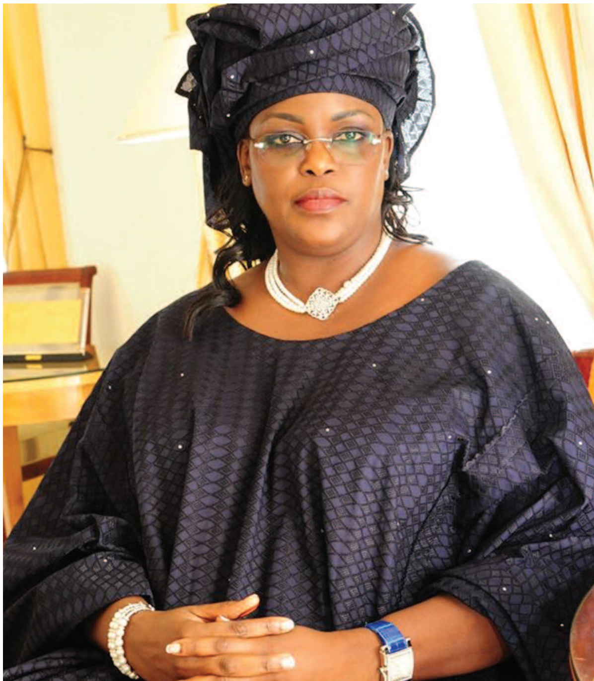
Macky Sall sont ressassés.

Les évacuations sanitaires. Les kits alimentaires pendant le ramadan. Les assistances discrètes... Mais avant tout une sénégalaise qui ne déteste pas l'ambiance des « mbootay » (associations de femme) comme quand elle se retrouve dans la grande cour de la concession des Sall au milieu de foudards bigarrés dans une ambiance festive alors que doléances (surtout) et engagements politiques derrière