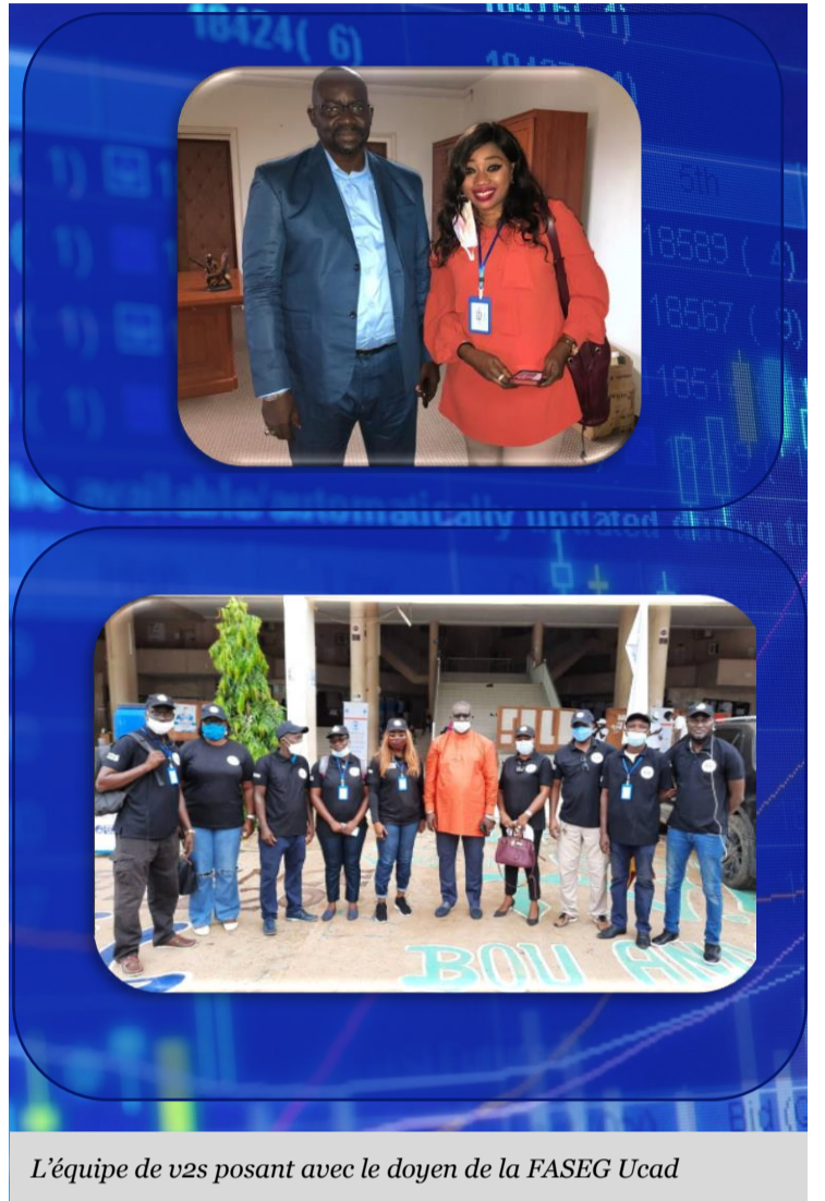
L'équipe de v2s posant avec le doyen de la FASEG Ucad

Il compte prendre en charge les frais d'inscription des étudiants en situation difficile, exonérer les frais de Scolarité pour les cas que V2S proposera allant de 25%, 75%, voire 100%.