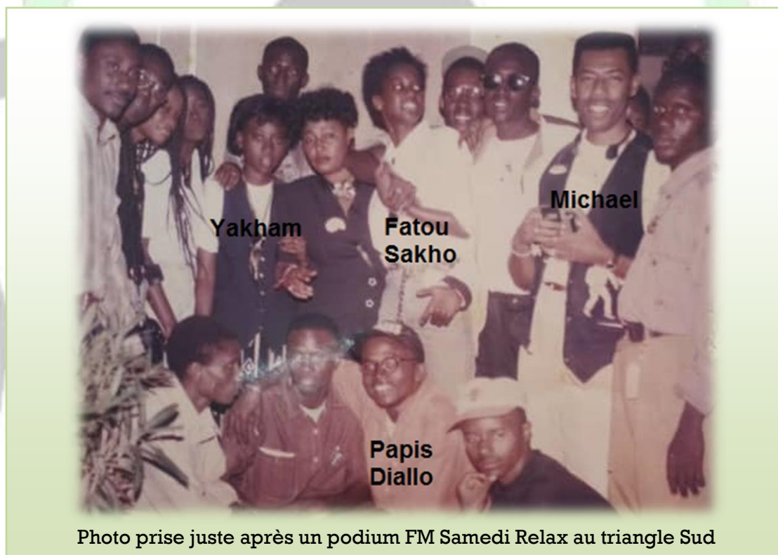
Photo prise juste après un podium FM Samedi Relax au triangle Sud